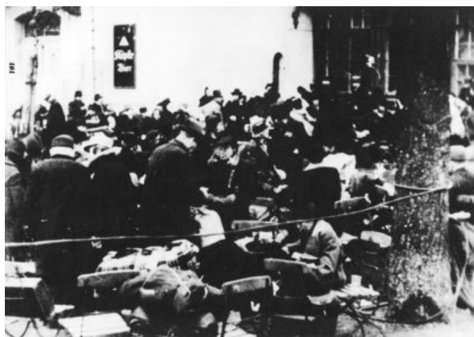
Deportacja Żydów z Wrocławia 1941-44: miejsce zbiórki, data wykonania fotografii nie znana.

Osoby noszące się z zamiarem emigracji, musiały zmierzyć się z ogromnymi biurokratycznymi i materialnymi kłopotami oraz szukaniami. Wielu Żydom nie udało się zdobyć wizy do kraju, do którego mieli zamiar emigrować, lub nie zdołali