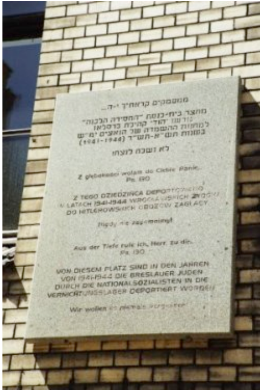
Na dziedzińcu przy Gminie Żydowskiej, obok Synagogi Pod Białym Bocianem, znajduje się tablica upamiętniająca Żydów deportowanych z tego miejsca.

Osoby wyznaczone do deportacji, otrzymywały pismo urzędowe, które informowało o dacie transportu. Pismo zawierało informacje, iż osoby te będą z powodu konieczności pracy przesiedlone. Wzywano je, aby w danym terminie stawiły się w punktach zbiórek. Punkty te mieściły się między dzisiejszą ul. Flisacką, a ul. Łowiecką oraz obok synagogi Pod Białym Bocianem. Większość transportów opuszczało Wrocław z dworca Nadodrze.